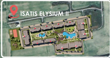
ISATIS ELYSIUM II