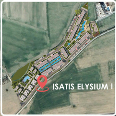
ISATIS ELYSIUM I